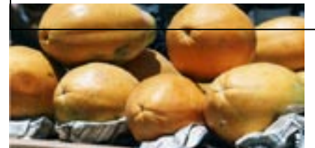
mamão sem agrotóxicos