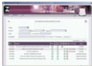
Portal da Rede GNV

O registro de instaladores de sistema de Gás Natural Veicular (GNV) ficou muito mais ágil e seguro. O processo de concessão e renovação do registro passou a ser realizado através do Portal de Relacionamento da RBMLQ-I/Rede Brasileira de Metrologia Legal e Qualidade. Os funcionários integrantes da rede recebem da Divisão de Programas de Avaliação da Conformidade (Dipac), responsável pelo Programa de GNV, login e senha para acessarem o Portal da Rede. A cada etapa do registro, o sistema indica a situação do instalador com sinais coloridos: verde, significa etapa finalizada; vermelho, ainda está pendente, e amarelo, utilizado somente no RVCI, indica que foi encontrada alguma não-conformidade.